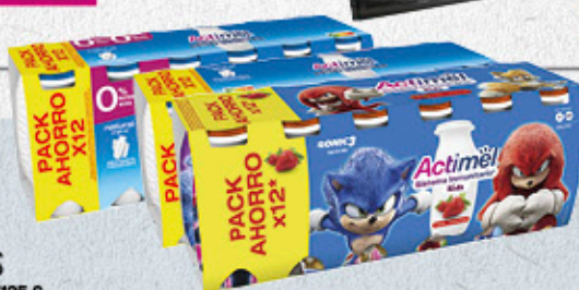
4,68€ ACTIMEL DANONE LÍQUIDO NATURAL, FRESCA KIDS O NATURAL 0% PACK 12X100 G EL KILO A 3,90 €