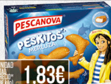
2ª UNIDAD A MITAD DE PRECIO* 1,83€ (4,59€ kilo)