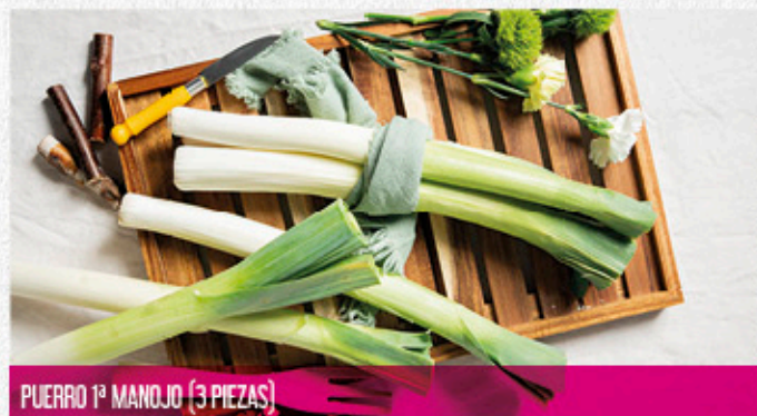
PUERRO 1º MANOJO (3 PIEZAS)