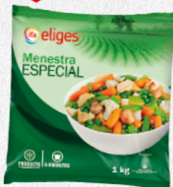
1,95€ MENESTRA ESPECIAL CONGELADA IFA ELIGES BOLSA 1 KG