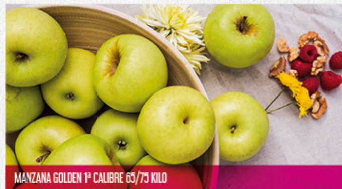
MANZANA GOLDEN 1º CALIBRE 65/75 KILO