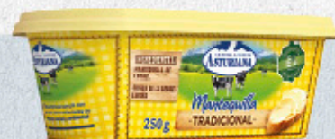
3,39€ MANTEQUILLA ASTURIANA TRADICIONAL TARRINA 250 G EL KILO A 13,56 €