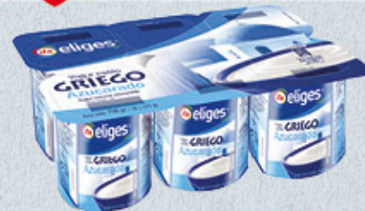
1,50€ YOGUR GRIEGO IFA ELIGES NATURAL AZUCARADO 6X125 G EL KILO A 2,00 €