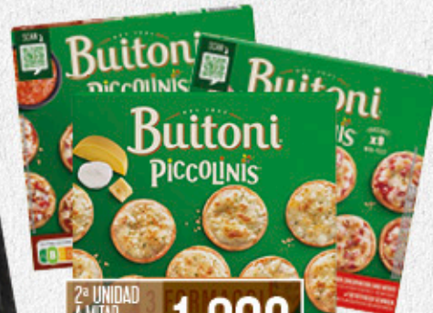
2ª UNIDAD A MITAD DE PRECIO* 1,98€ (7,33€ kilo)