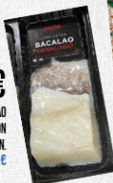
7,49€ LOMO BACALAO CONGELADO OUTON DESALADO 340 G PN. EL KILO A 22,03 €