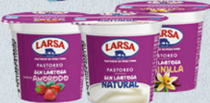
0,40€ L.F. SIN LACTOSA LARSA NATURAL, VAINILLA O FRESCA VASO 125 G EL KILO A 3,20 €