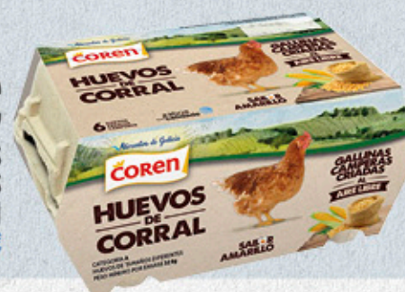
1,95€ HUEVOS CAMPEROS COREN M (53-63 G) 6 UNIDADES (LIBRES DE JAULA) LA DOCENA A 3,90 €