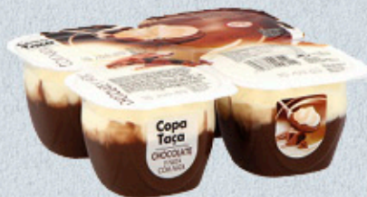
1,25€ COPA CHOCOLATE Y NATA PACK 4X115 G EL KILO A 2,72 €